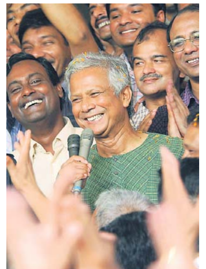
Mohammed Yunus. Der Ökonom setzt auf die Macht der Bürger.

ZWEI TRÜMPFE. Doch Yunus kann – zumindest vorläufig – auf zwei Trümpfe setzen. Die internationale Gebergemeinschaft, die Bangladesch mit Hilfgeldern in Millionenhöhe versorgt, glaubt an den «Bankier der Armen». Bangladeschs Militärs geben ihm ebenfalls Rückendeckung. Doch diese Allianz könnte sich als ein Pakt mit dem Teufel erweisen.