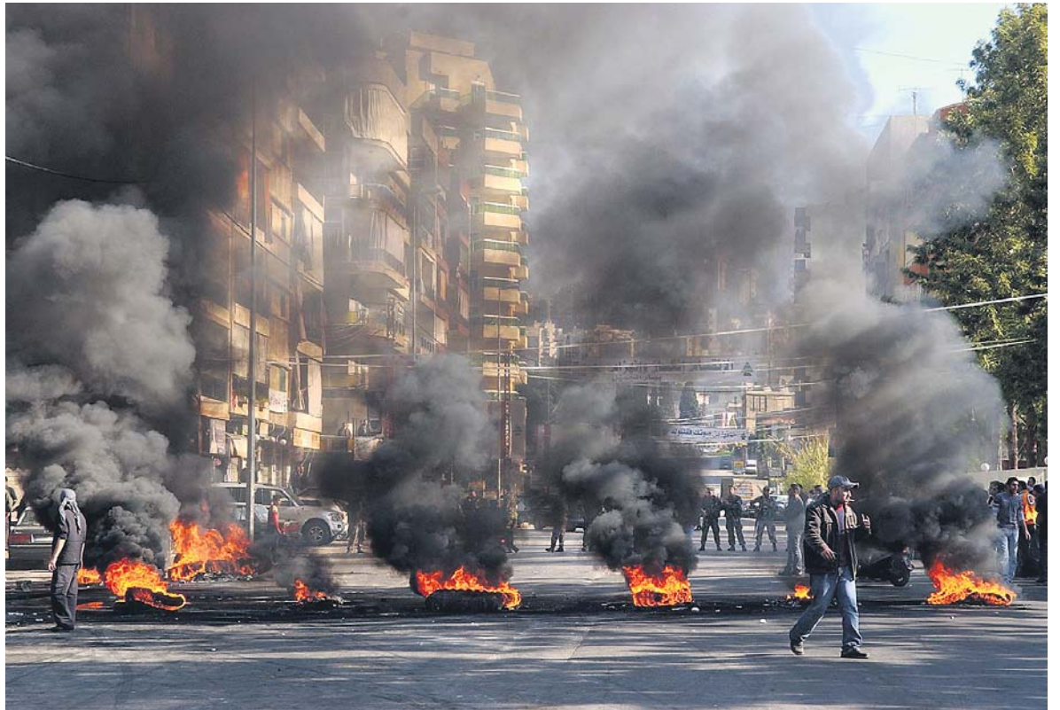
Spiel mit dem Feuer. Strassenblockaden sind Teil des Protests, mit dem die Opposition die Regierung stürzen will.

Das hängt mit der Geschichte des Landes zusammen, genauer mit dem Niedergang des Osmanischen Reichs im 19. Jahrhundert, der damaligen Besatzungsmacht. Grossmächte jener Zeit wie Frankreich, England und Russland traten zunehmend als Beschützer der verschiedenen konfessionellen Gemeinschaften auf. Die Engländer adoptierten Drusen und evangelische Christen, die Franzosen nahmen die maronitischen Christen in Schutz, Russland die orthodoxen Christen. Seither haben wir Libanesen